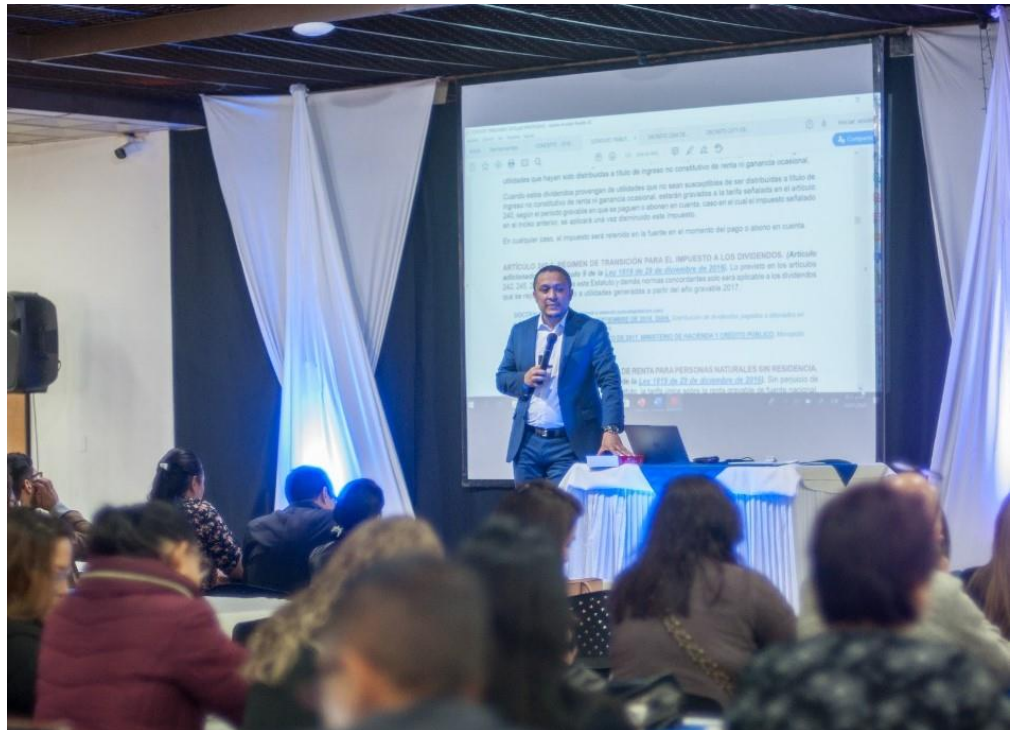
Seminario Régimen Simple de Tributación 2020