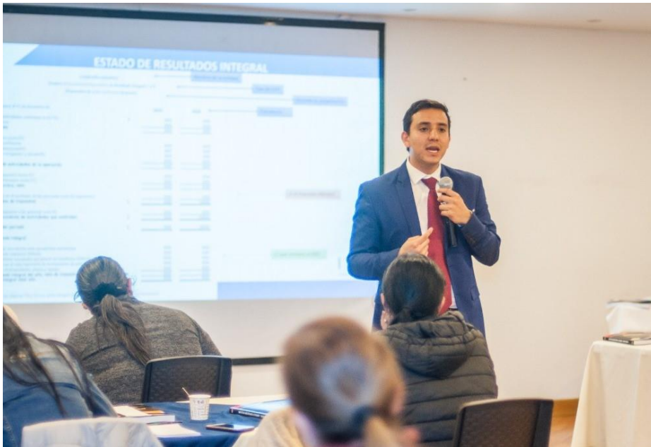
Seminario Declaración de Renta persona Jurídica 2020