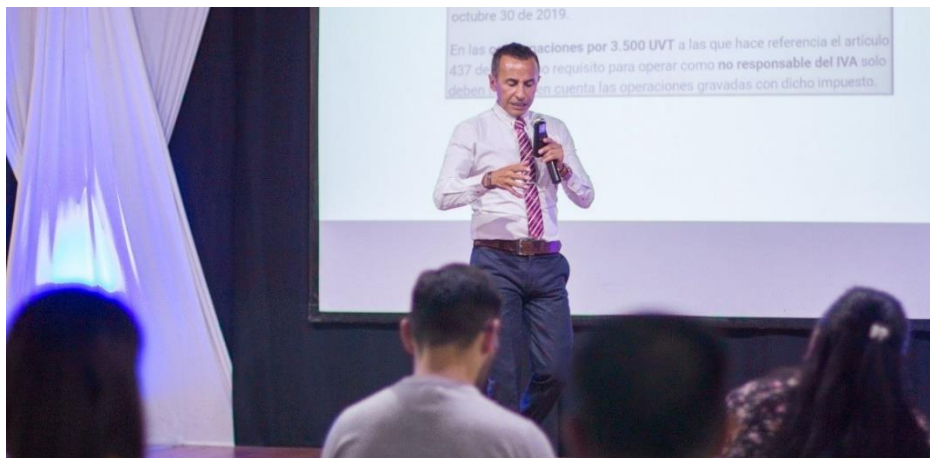
Seminario Conciliación Fiscal 2020